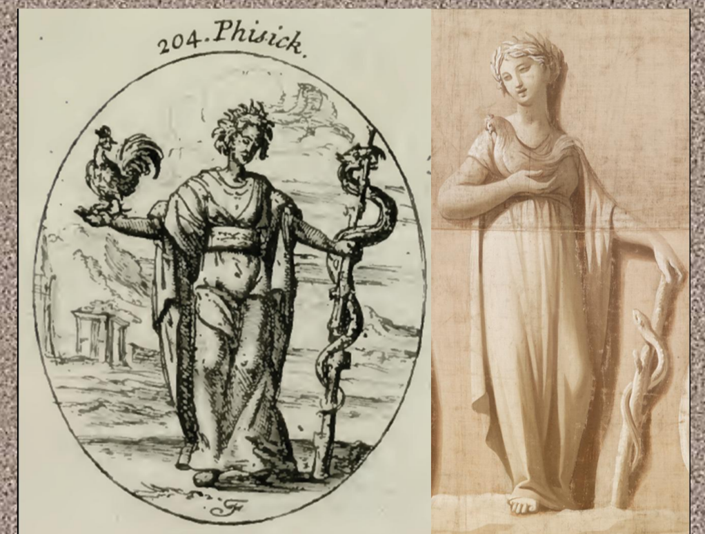
Personificación de la Medicina, según modelo de Ripa