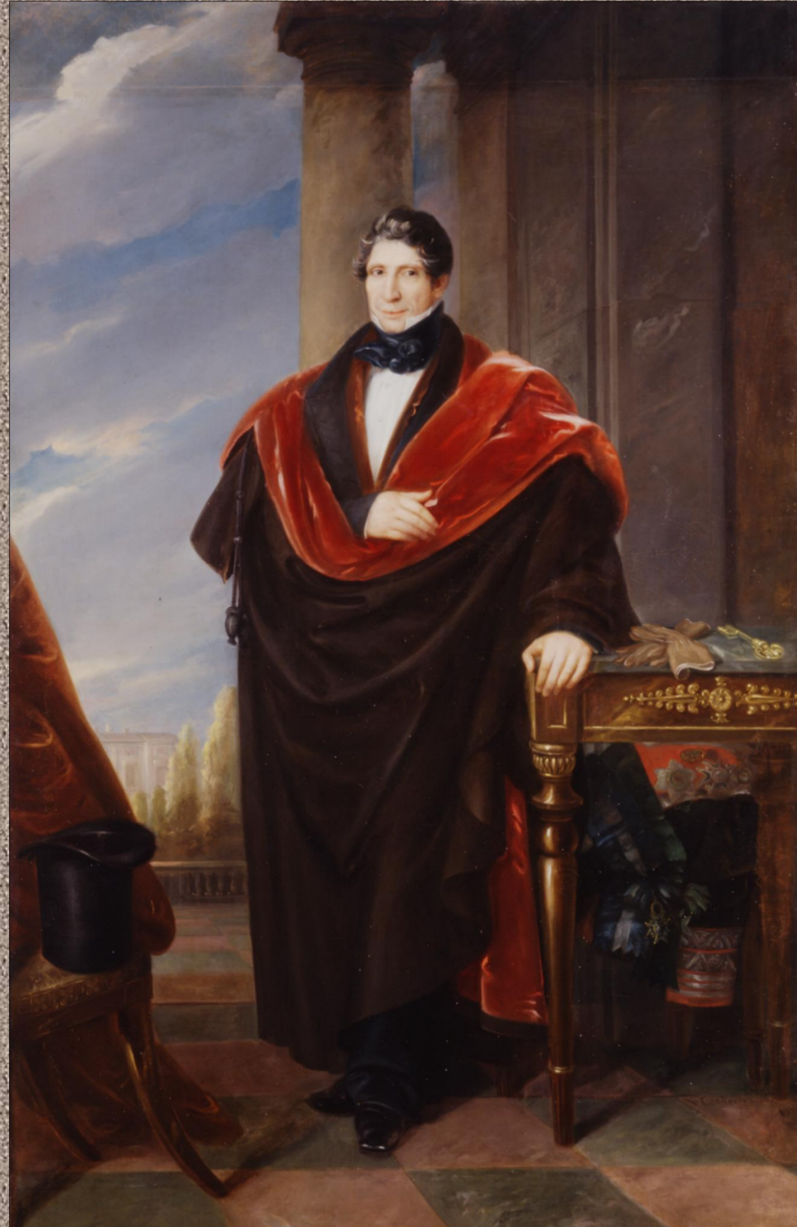
Valentín Carderera y Solano, 1833. Fernando de Aguilera y Contreras XV Marqués de Cerralbo . Óleo sobre lienzo, 216 x 138 cm. Museo Cerralbo, Madrid. Inv. VH 0496