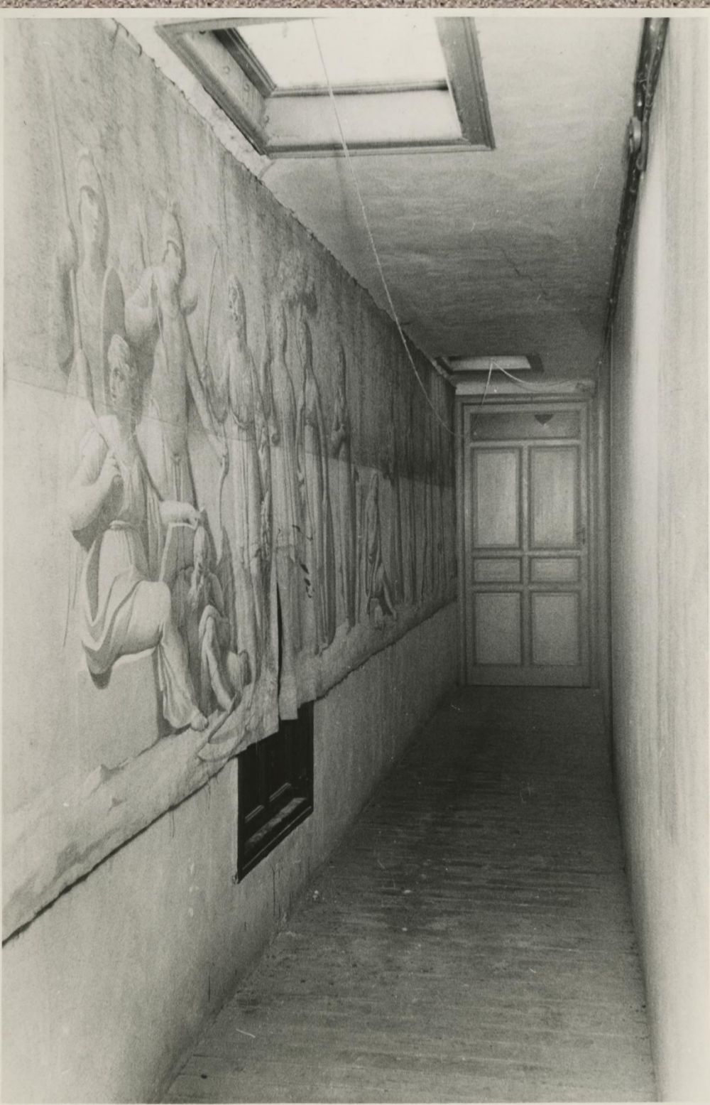
Instalación de la sarga de Zacarías González Velázquez. Pasillo, ventanales y puerta del piso 3º. 1,67 m alto x 23,89 m largo. Museo Cerralbo, Madrid. Invs. 05598 y 05599 (1819)