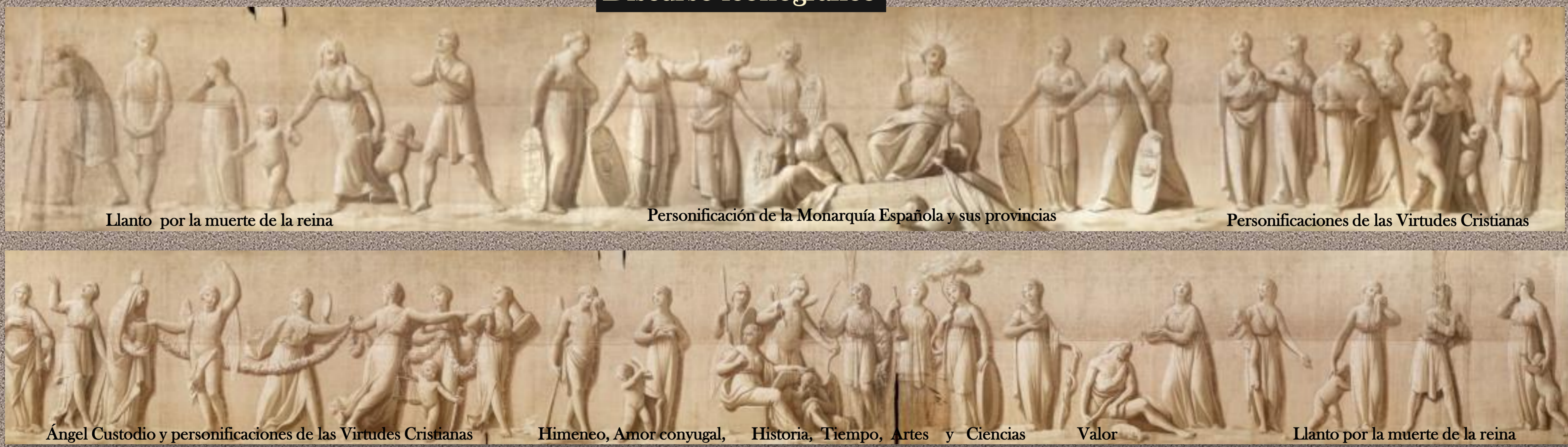
Llanto por la muerte de la reina