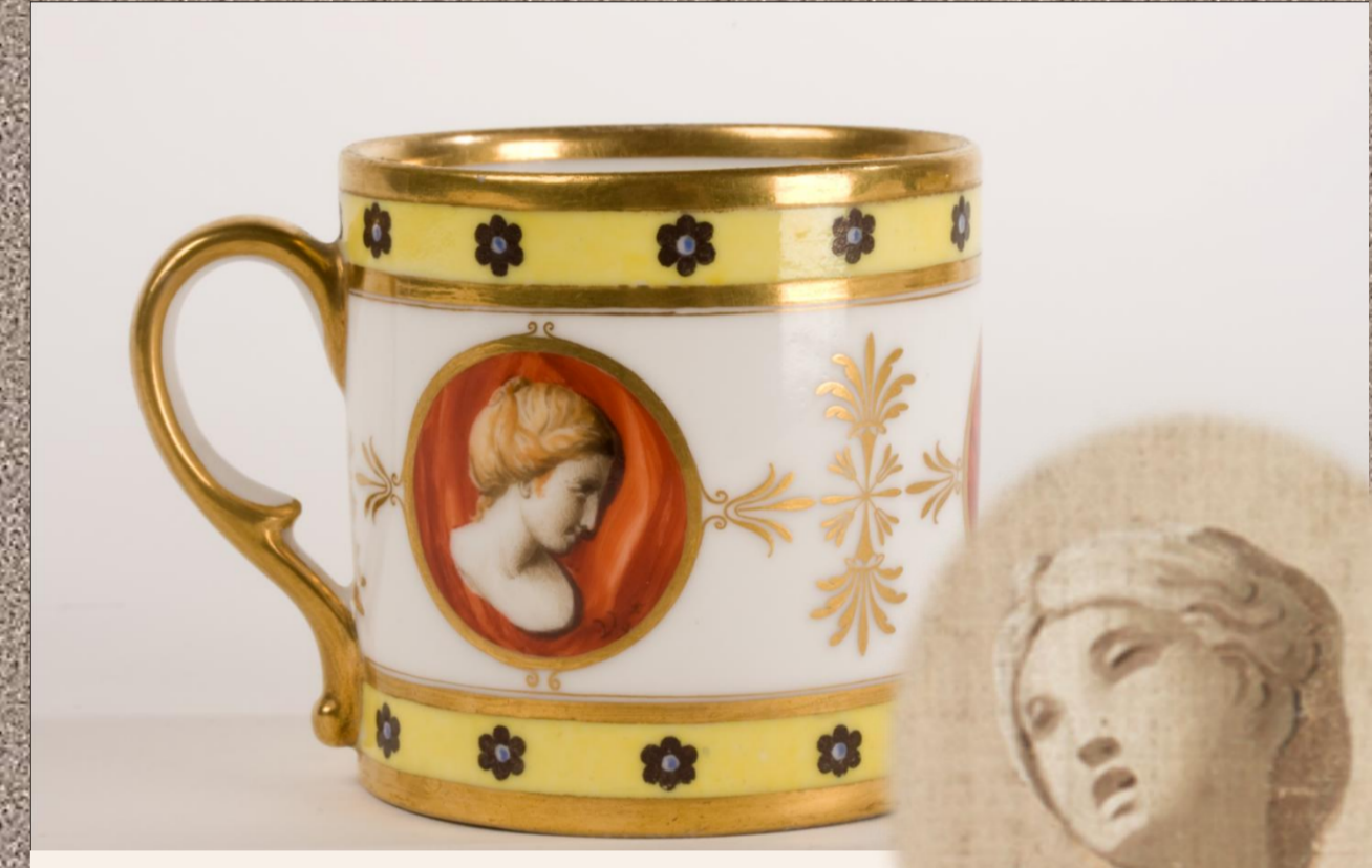
Taza. Real Fábrica del Buen Retiro. Decorador: Cástor González Velázquez . Museo Cerralbo, Madrid. 7 alt x 8 diám cm. Inv. 02031