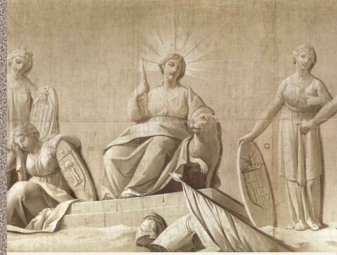
Zacarías González Velázquez. Cortejo fúnebre de María Isabel de Braganza (detalle), 1819. Aguazo sobre sarga (tafetán). 167 x 1.300 cm. Museo Cerralbo (inv. 5598).

GONZÁLEZ VELÁZQUEZ, I. (1819): Descripción del cenotafio erigido para las reales exequias de la reina nuestra señora D.ª María Isabel de Braganza, celebradas en el día 2 de marzo de 1819 en la iglesia del real convento de San Francisco el Grande de esta corte: inventado y dirigido, de orden de S. M. Católica el Sr. D. Fernando VII., por su arquitecto mayor D. Isidro Velázquez. Madrid, Imprenta de Vega y compañía. Biblioteca del Ayuntamiento de Madrid