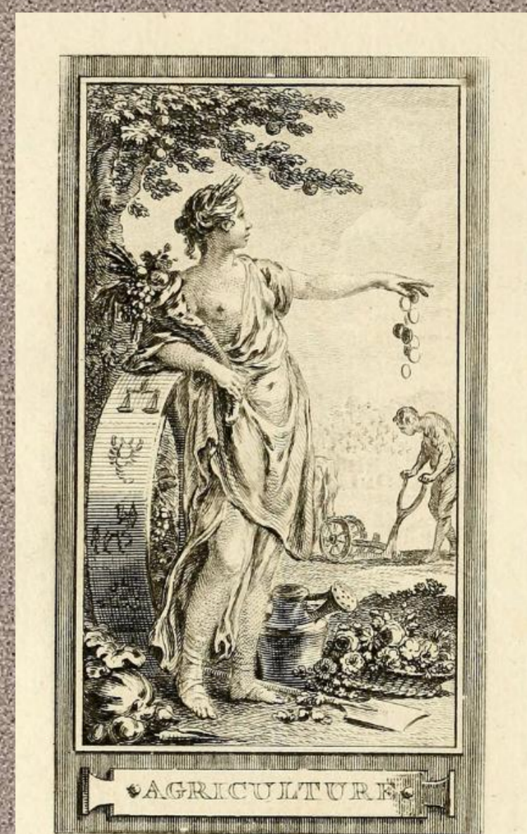
Personificación de la Agricultura. Gravelot