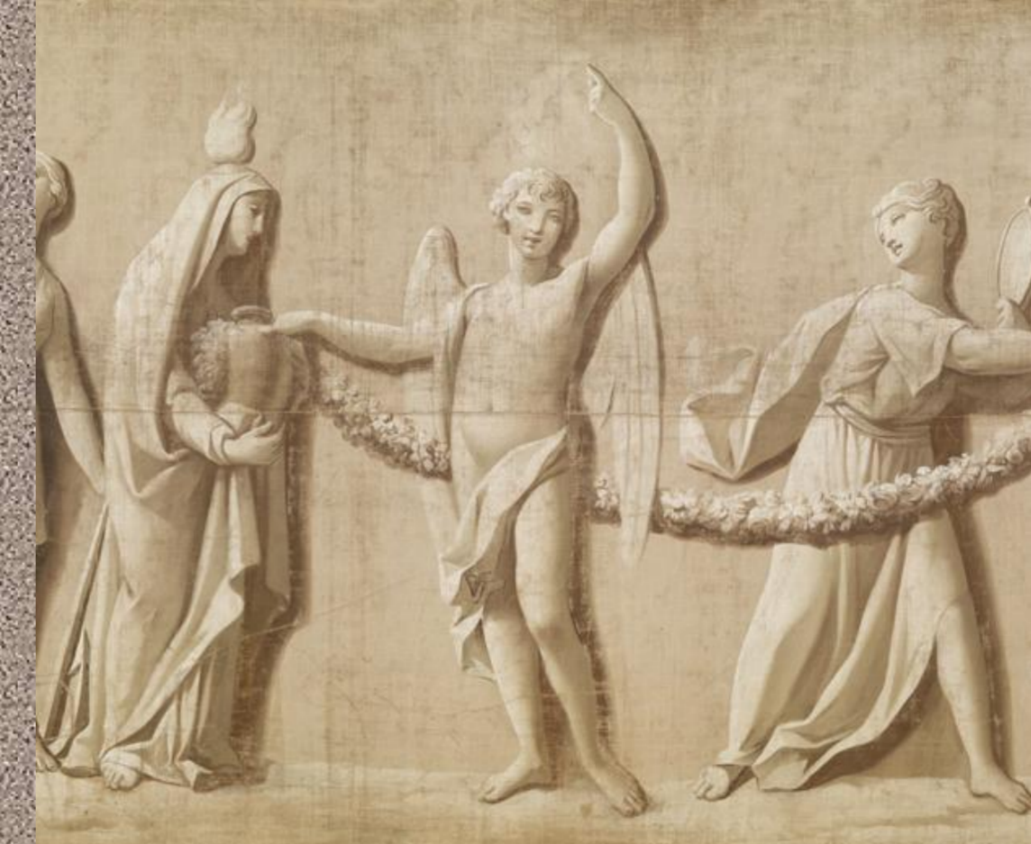
Zacarías González Velázquez. Cortejo fúnebre de María Isabel de Braganza (detalle) , 1819. Aguazo sobre sarga (tafetán). 167 x 1.300 cm. Museo Cerralbo (inv. 5598).