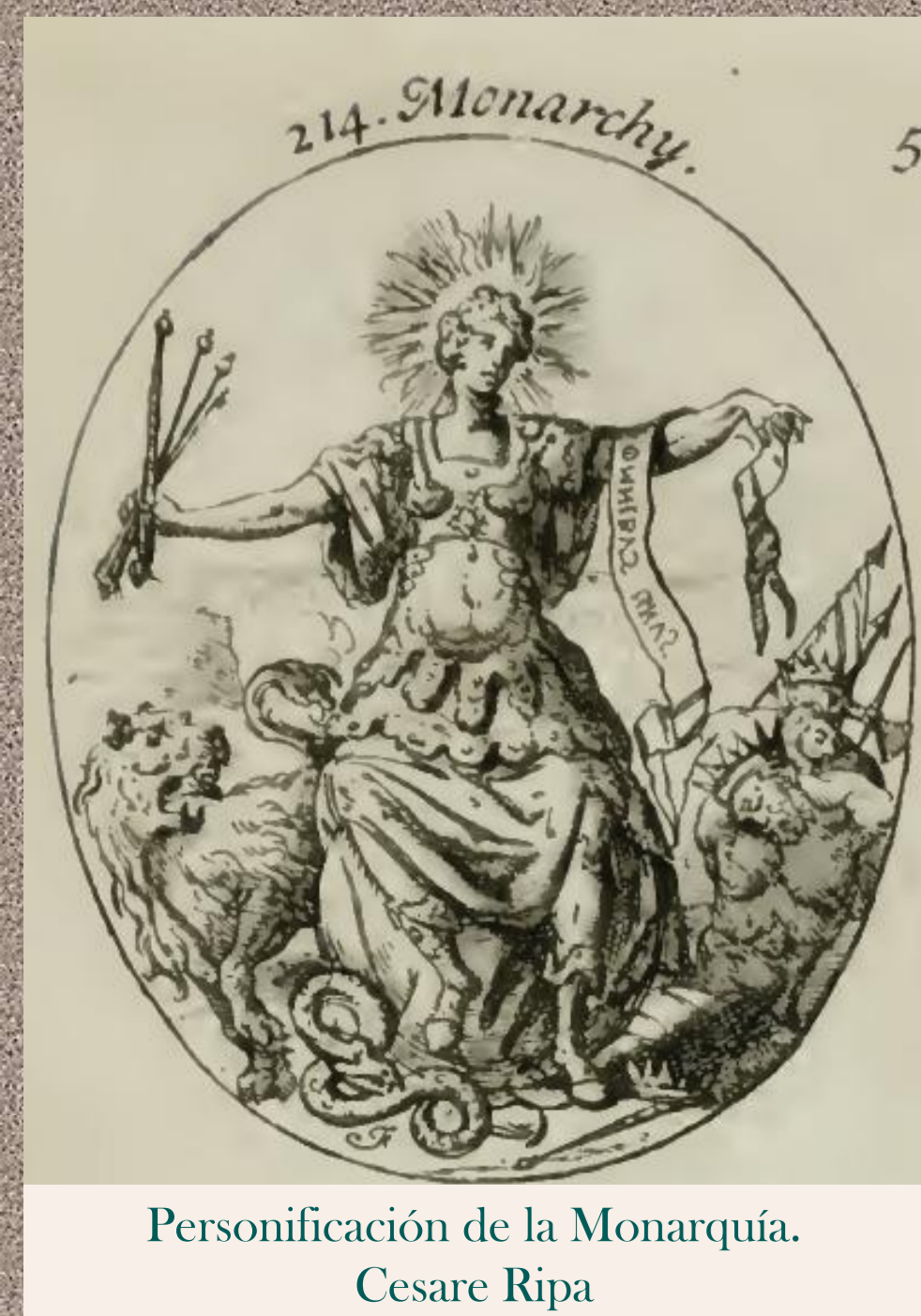
Personificación de la Monarquía. Cesare Ripa